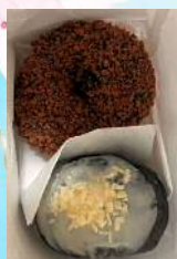
DIABLE (ディアブル) 生ドーナツ 延岡市